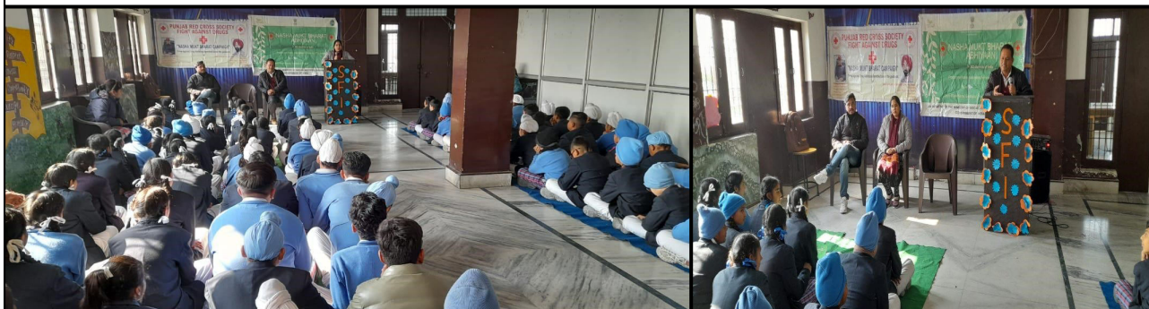
Awareness Session at Govt Senior Secondary School at Spring field International School, Gurdaspur