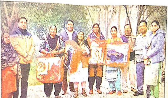
ਗੁਰੂ ਨਾਨਕ ਦੇਵ ਹਸਪਤਾਲ ਦੇ ਰੈੱਡ ਕਰਾਸ ਵਲੋਂ ਮਿਲੇ ਕੰਬਲ ਨਾਲ ਖੜੇ ਨੌਕ।

and consuming it. In fact, the students also eventually become a part of their network and start dealing in it. The team also stressed upon building moral values and to be a good human being. Also they were informed about the activities of the centre and free treatment/accommodation provided to the patients. At this event students took oath not to touch any kind of drug and to become the part of this abhiyan to spread relevant information.