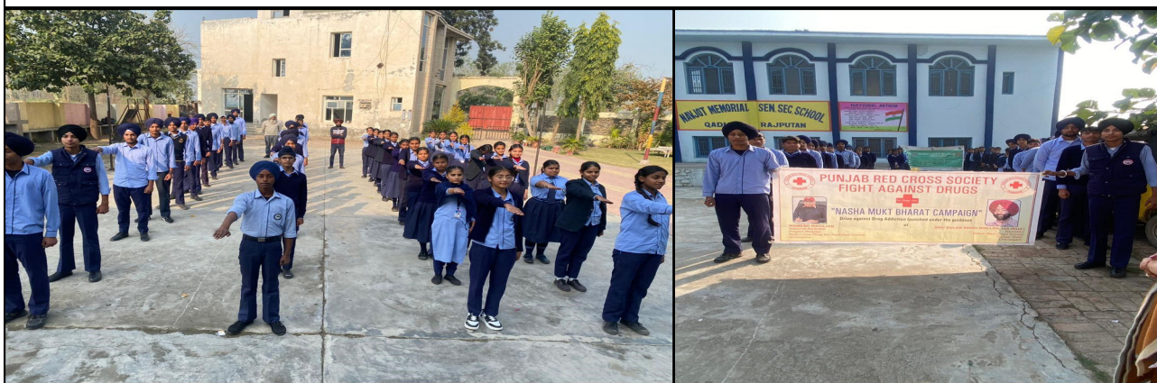
Awareness Session at Navjot Memorial Sr. Sec. School, Qadian Rajputan, Gurdaspur by DDC Gurdaspur