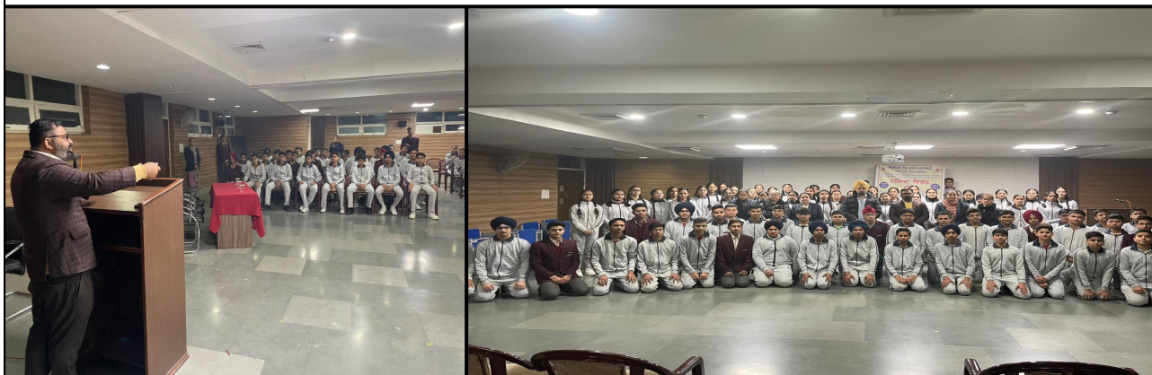
Awareness Session at DAV Global School Patiala by DDC Patiala