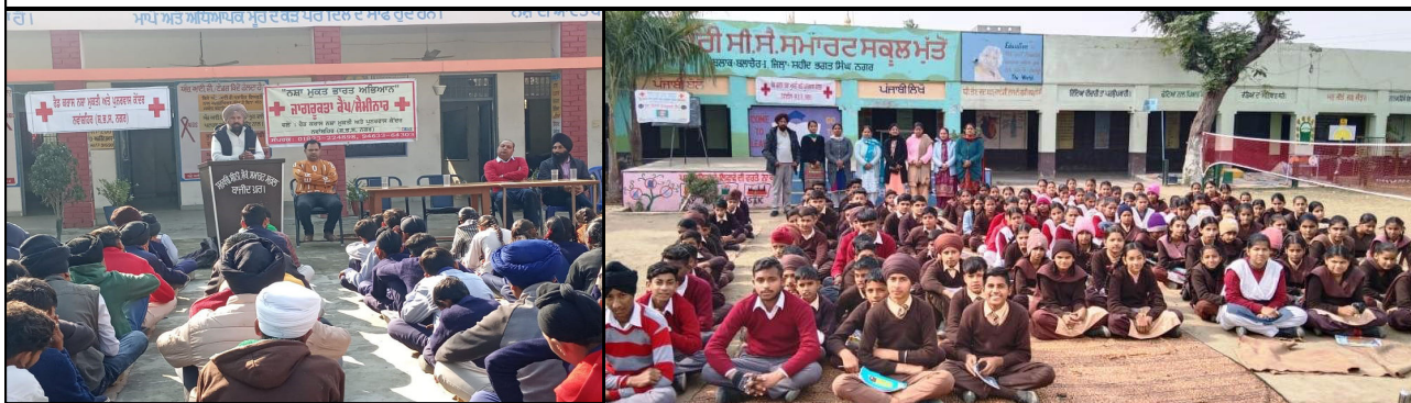
Awareness Session at Govt Senior Secondary School at Mutton by DDC Nawanshaher