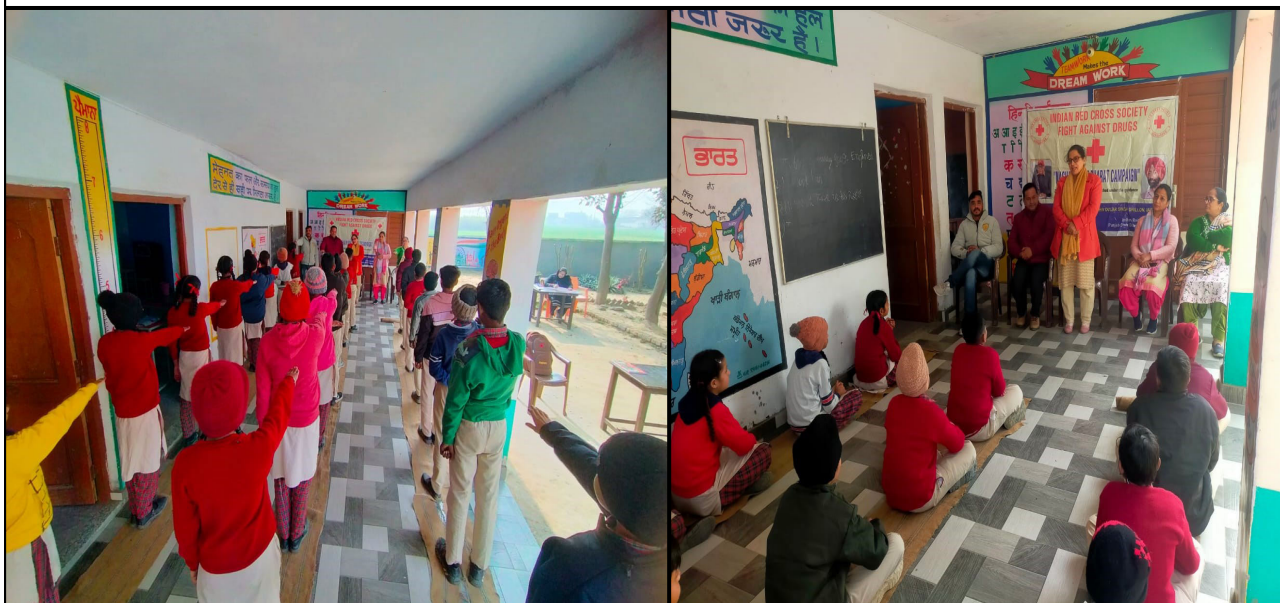
Awareness Activity by Drug De-addiction Centre Gurdaspur at Primary School